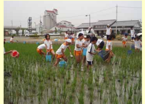
ニゴロブナ放流状況