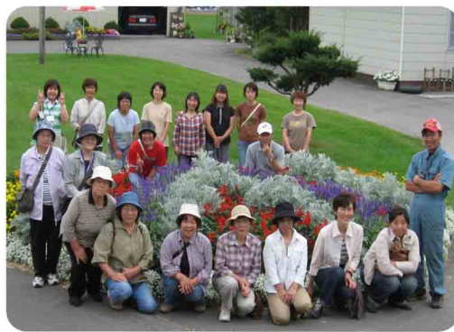
長正路さんと奥さまとで記念撮影