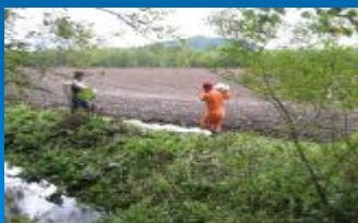
屈斜路川湯資源保全推進会議