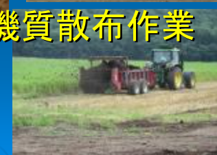
屈斜路川湯資源保全推進会議