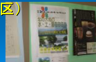
屈斜路川湯資源保全推進会議