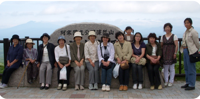
小清水展望台で記念撮影