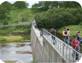
矢臼別演習場内の砂防ダム